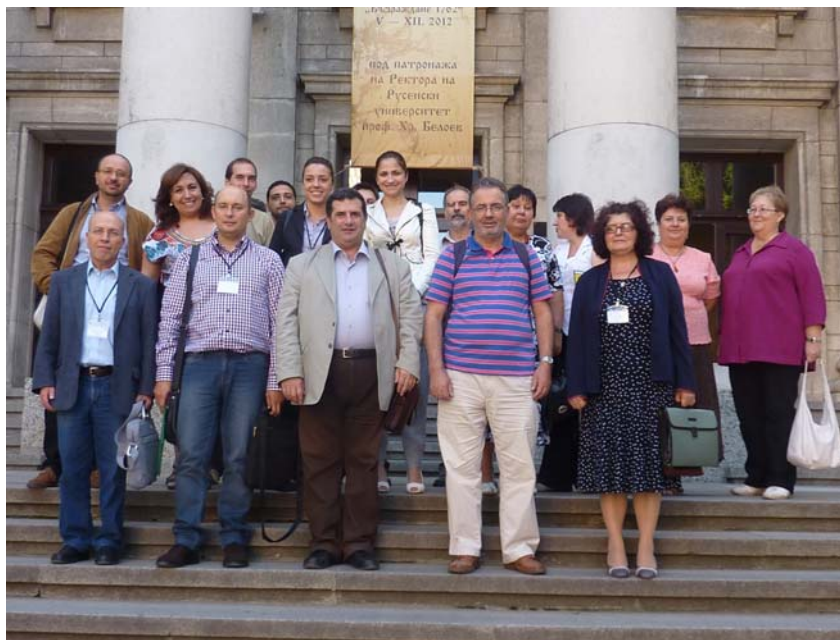
Участници в NODDEA'2012

Катедра Математика, каб. 1.221. Факултет Природни науки и образование, Русенски университет „Ангел Кънчев”, ул. Студентска 8, 7017 Русе