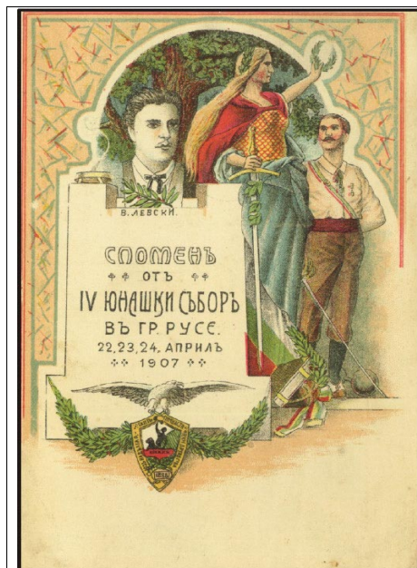
Фиг.6 Литографна картичка за събора