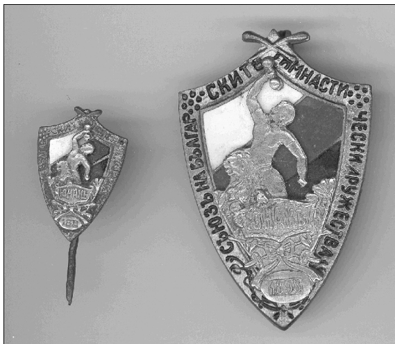
Фиг. 2: Значки на съюз на българските гимнастически дружества "Юнак"

1899г на извънредно събрание на русенското дружество се избира за почитен член юнака Станислав Кличиан за подарените от него 300 броя значки за юнашката среща в Русе.