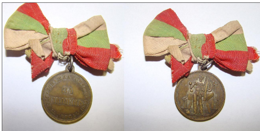
Фиг. 3: Значка за първа юнашка среща 1899г.

През 1901 г. се разделя на две дружества – "Юнак" и "Русенски юнак". Дружество "Русенски юнак" изработва за своите членове бронзова посребрена значка с размери 38 x 30 mm. Тя е с богата символика: в средата коронован лъв