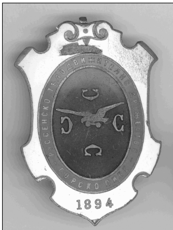
Фиг. 1: Значка на „Русенско телодвижително дружество – „Горско пиле” ”

На 8.11.1898 г Русенското дружество се преименува в гимнастическо дружество “Юнак”.