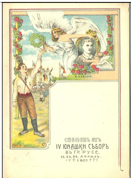
Фиг. 7: Новооткрита пощенска карта за IV юнашки събор.

Представям на вашето внимание новооткрита литографна пощенска картичка за IV юнашки събор в Русе, която се публикува за първи път (Фиг. 7). Картичката е наситена с богата символика: юнак с трикоьорна лента през гърдите, портрет на Васил Левски, юнаци играещи гимнастически упражнения, жена символизираща България връчва лавров венец на юнак, българското знаме, арки и др. Пет редов надпис "Споменъ отъ/ IV юнашки съборъ / въ гр. Русе / 22, 23, 24, априлъ / 1907".