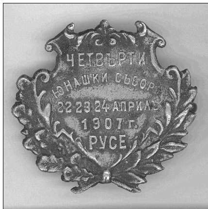
Фиг 5: Значка за IV юнашки събор - Русе 1907г.

Освен със значки ръководството на дружество "Юнак" отбелязва различните събития и с отпечатване на пощенски картички. Всички са със стандартния размер 135 mm x 90 mm и включват надписите: "България" Пощенска карта" място за пощенска марка, за адреса и др. на обратната страна на пощенската карта.