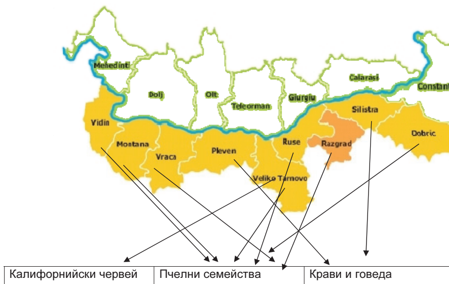
Фигура 2. Предпочитания на младите фермери за сектор Животновъдство

На фиг. 2 се показани предпочитанията на земеделските производители по области в сектор животновъдство [5].