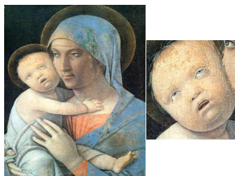
Фигура 4. „Мадона с младенеца” - картина на Andrea Mantegna (1431-1506)