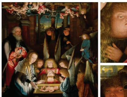
Фигура 8. „Рождество Христово“ ( http://www.metmuseum.org/ )

Днес, от позициите на новото време, можем да предположим, че всички тези творци са видяли нещо много специално у хората със синдром на Даун, толкова специално, че да изобразят «Спасителят» с тези характеристики.