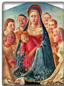
Фигура 6. „Мадона с детето“ („Мадона на пещерите“)- картина на Andrea Mantegna в галерия Уфици, Флоренция