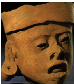
Фигура 1. Фигура от Tumaco - La Tolita културата, датираща около 500 год. пр. Хр., която демонстрира ясно клиничните проявления на синдрома на Даун при дете (om http://ru-downsyndrome.livejournal.com/12382.html ).