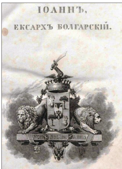
Фигура 1. Калайдович К. Ф. Иоанн, екзарх Болгарскій: Исследование, объясняющее историю словенского языка и литературы IX и XI столетий. М., 1824

В настоящия анализ ползваме текстове от Калайдович К. Ф. [8], който в 1824 година преоткрива и връща Йоан Екзарх в световната култура Фиг.1 и от „Древна Православна Църковно Славянска Книжнина събрани и обработени от Владислав Славов“ [18]