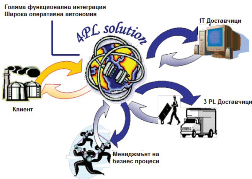
Фиг. 4. Принципна схема на 4 PL оператор

компанията контролира и координира дейността на логистичните оператори от името и за сметка на товародателя, който сключва договорите с тези оператори. Тя е доверен партньор и част от логистичната структура на клиента, като разработва оптимални от негова гледна точка логистични схеми и процеси. В този смисъл не може да се разглежда като 4PL консултации, давани на товародателите от транспортни или логистични оператори, тъй като те целят да дадат не най-доброто възможно решение, а най-доброто решение в рамките на извършваните от съответния оператор услуги [3].