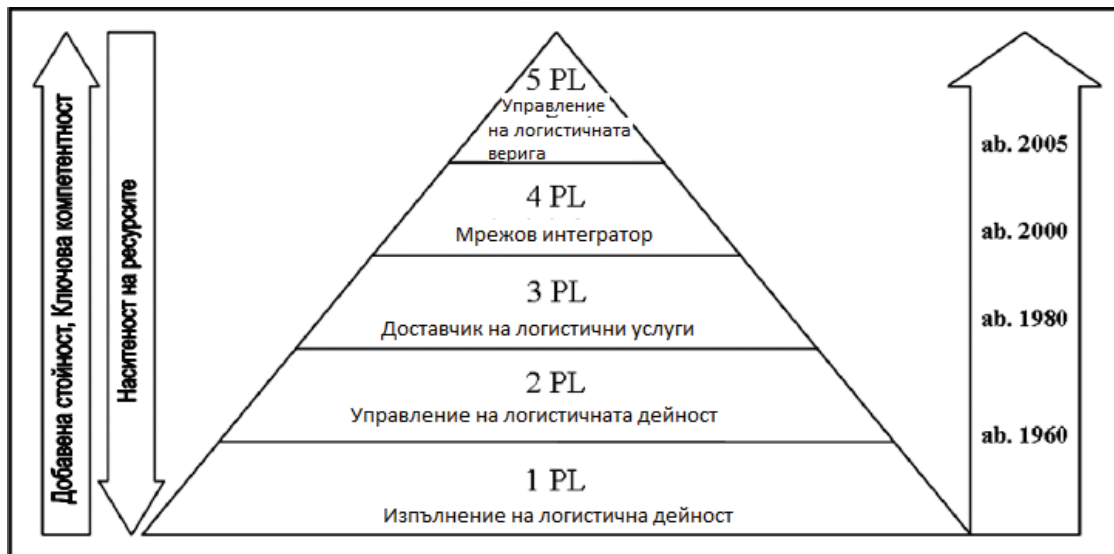
Фиг.1. Развитие на логистичните партньори

като транспортни средства, складове и/или товаро-разтоварна техника. 1PL може да бъде производител, вносител, износител, търговец на едро, търговец на дребно или дистрибутор в областта на международната търговия, институция (държавно учреждение), индивидуален клиент/семество, които извършват преместване на товар от едно място на друго. Може да се обобщи, че всеки, който има преместени стоки от мястото им на произход до ново място се счита за първа-страна логистичен доставчик.