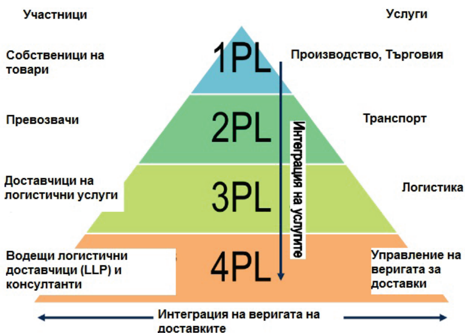
Фиг.2. Интеграция на веригата за доставки

На фиг. 2 е показана интеграцията на веригата на доставките.