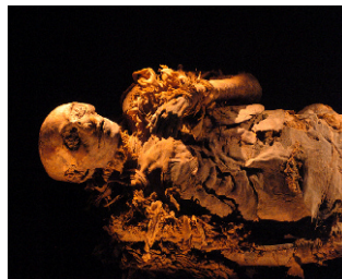
Близък план на мумията на Хатшепсут. (Egyptian museum in Cairo)

Хатшепсут умира след 22 години царуване – период, в който египетската архитектура достига високи върхове. Нейните изображения са заличени от по-късните царе, които изглежда не приемат, че една жена може да е фараон. Хатшепсут е погребана в Долината на царете. Гробницата ѝ е свързана с храма в Деир ел-Бахри чрез огромни обелиски. В Карнак фараоните на Древен Египет се надпреварват за прослава, създавайки най-големите религиозни монументи в света. Всеки един владетел се заема да надмине предшественика си. Карнак символизира съперничеството и обелиските са мерило за това. Хатшепсут се погрижила нейните обелиски да засенчват тези на баща ѝ – Тутмос I.