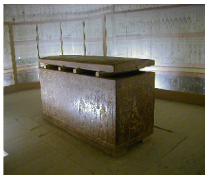
Саркофагът на Хатшепсут (Museum of Fine Arts, Boston)

15 години Хатшепсут работи в екип с архитекта си Сенмут, който става като част от семейството. Той е един от любимците на царицата. На него е поверена и главната грижа за възпитанието на първата ѝ дъщеря Неферуре. Няма доказателства, че Хатшепсут и Сенмут са били любовници, но той получава правото да си има своя гробница под предния двор на храма. Там са открити изключително интересни изображения, които не се срещат в нито една друга гробница: на тавана на гробницата са нарисувани различни съзвездия и диаграма на зодиака и зодиите. Образът на Сенмут е открит и във вътрешността на храма в Деир ел-Бахри, което е доста необичайно, тъй като само царете и боговете се изобразяват по вътрешните стени на храмовете, върху "скрити от погледа повърхности". [2:80] Не се знае какво се случва с него. Сенмут изчезва неочаквано от двора. Няма доказателства къде е погребан, а и тялото му не е открито в нито една от гробниците му. [2:80-81]