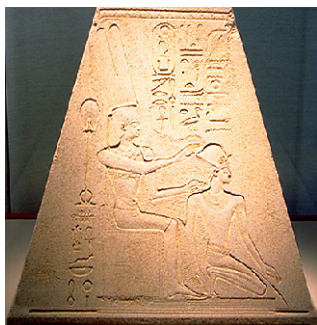
Най-горният камък от обелиска на Хатшепсут, на който е настъпилата метаморфоза – преминаването от женски външен вид към мъжки (Egyptian museum in Cairo )

III във всички книга и документи, но на деветата година от своето управление името му изчезва, а това на Хатшепсут става единственото царско име. Получава и всички символи на царската власт. В официалните документи тя дори използва мъжки граматически форми, като променя името си на Хатшепсу и се вписва като Негово Величество Хатшепсу.[5] Облича се в мъжки дрехи, за да изглежда като истински фараон. Първоначално е изобразявана в женски одежди, под които ясно личи женското тяло. После роклите се сменят с къси мъжки туники, чертите на лицето ѝ загубват, а бюстът ѝ изчезва съвсем. Накрая се появява и добре оформена брадичка.