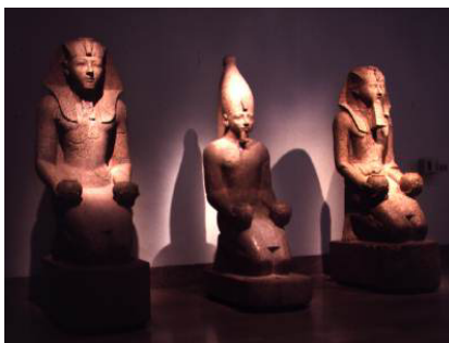
Това са три различни фигури на фараон Хатшепсут, при които ясно личи изобразено короноването на владетелката от бог Амон и получаването на царските символи. (Egyptian museum in Cairo )