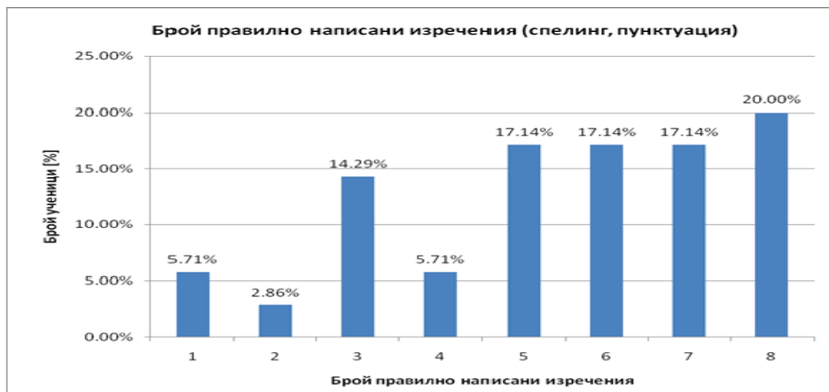
Диаграма №2. Разпределение на броя на правилно написаните изречения във втора задача (спелинг, пунктуация, смисъл, без липсващи думи)

Една пета от четвъртокласниците (20%) са написали всички изречения с правилен спелинг, пунктуация и без липсващи думи. По-голямата част от тях (57,13%) са съставили правилно между четири и седем изречения, т.е. повече от половината възможни. При една пета от изследваните лица (22,86%) са регистрирани само по едно, две или три правилни изречения – под 50% от възможните. Направените грешки са описани в Таблица №2.