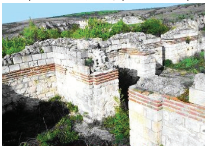
Митрополитска църква от XIII в., разкрита в началото на XX в.

През 1235 г., на църковен събор в Лампсак (Мала Азия, за уточнение: майстори