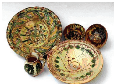
Сграфито керамика от Червен

Сграфито керамиката е заемала важно място във всекидневието на жителите на града. Тук тя е преобладавала с пъти спрямо обикновената керамика и е употребявана в по-голямо количество в сравнение с редица средновековни български градове. Разнообразието на мотивите и пъстротата на цветовете на сграфито керамиката свидетелстват за естетическия вкус и жизнерадостното в светуосещането на червенските граждани [4].