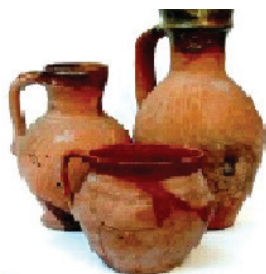
Обикновена керамика от Червен

Тези, които са покрити с глеч върху бяла ангоба или имат рисунки от бяла ангоба се отнасят към художествената керамика. Художествената керамика в Червен е украсена с техниката сграфито. При тази техника съдовете се покриват с