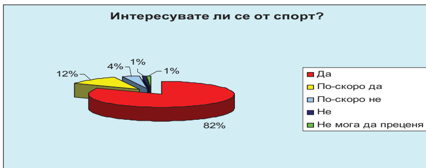
Фиг. 1. Разпределение на отговорите на въпроса „Интересувате ли се от спорт?“

Фактът, че за около три седмици анкетата бе попълнена от близо 10 000 респонденти показва, че обществото определено не е безразлично към развитието на Физическото възпитание и спорта (ФВС) в България. Уводният въпрос в нея показва, че 94 % от анкетираните най-общо се интересуват от спорт (фигура 1).