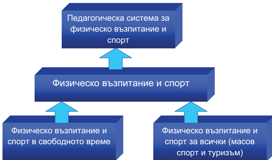
Фиг. 3 Педагогическа система за физическо възпитание и спорт за профилактика на различни форми на социално-негативно поведение на подрастващи

Педагогическата система за физкултурна дейност, за превенция и профилактика на различни форми на социално-негативно поведение при ученици е разработена в съответствие с Националната програма за развитие на физическото възпитание и спорта, фиг. 3.