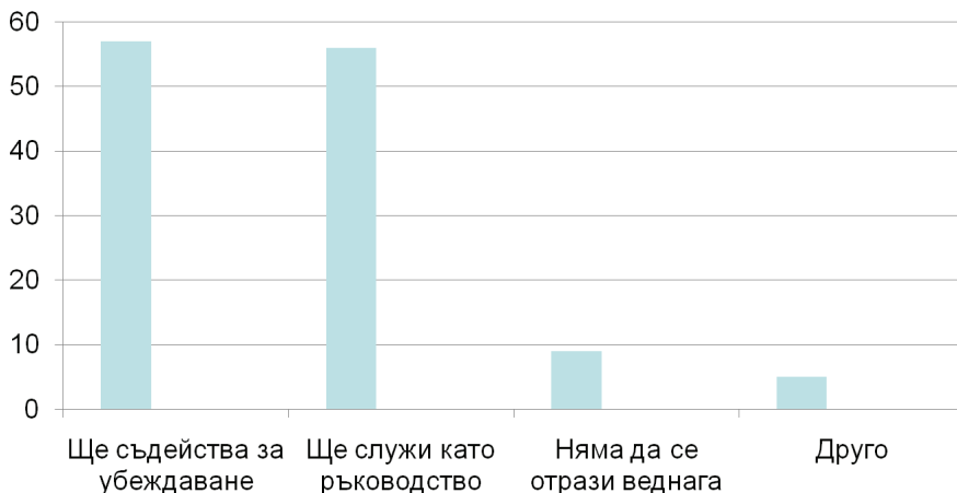
Фигура 2. Влияние на Европейска стратегия за интернационализация в университетите

Желателно е засилване на европейските инструменти за интернационализация като съвместни бакалавърски, магистърски и докторски програми и др. Въздействието на Европейската стратегия достига дори отвъд държавите членки на ЕС, които са страни в двустранни и други споразумения по европейски образователни програми.