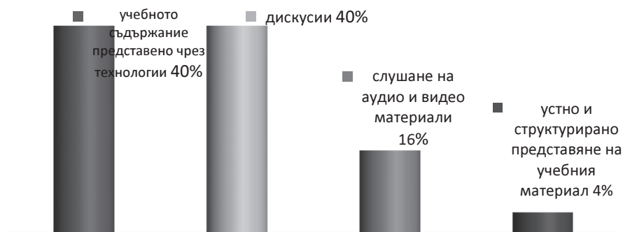
Фиг. 2 Предпочитани от студентите стратегии на учене

Следователно студентите осъзнават необходимостта от по-доброто представяне на учебния материал, което би довело до постигането на по-добро равнище на чуждоезикова подготовка и на ефективна личностна реализация в професионален план. На въпроса: „Кои са предпочитаните от Вас стратегии на учене за постигане на по-добри резултати в чуждоезиковата Ви подготовка?“ 40% от запитаните студенти по спортпредпочитатпредставянето на учебното съдържание чрез използването на технологии – интернет, мултимедия, видео филми и клиповеи 40 % от тях вярват, че дискусиите по време на учебните занятия биха подобрили чуждоезиковата им подготовка (фиг. 2). Може да се каже, че слушането на аудио и видео материали (16%), както и устното и структурирано представяне на учебния материал от страна на преподавателя (4%) не са от най-предпочитаните стратегии за учене от страна на бъдещите тренъори. Акцентът според тях трябва да се постави върху дискусиите от спортната практика и представянето на спортната терминология чрез използването на разнообразни технологии в обучението по чужд език.