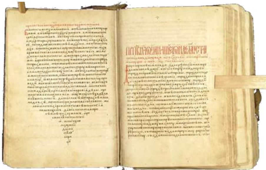
Фиг. 5. Прологът към пълната редакция на Златоструй

В паметта на своите сънародници великми въ князихъ князь Симеонъ остава най-вече като владетелят – книголюбец, който, като трудолюбива пчела, дири в словесните дълбини скритите мъдрост и знания, и придобил ги, ги излива, подобно на сладък мед, пред болярите, за да просвети техните умове. В този смисъл е и съпоставката на княза с цар Птолемей, станал за византийците символ на ерудит и библиофил. Заслугата на Симеон е в личната му ангажираност към просвещението на по-първите измежду неговите люде и в активното му участие в книжовния живот като поръчител и съставител на енциклопедични и антологични трудове, отговарящи на високите интелектуални потребности и възможности на тогавашното българско общество. „Всеки, прочитайки прилежно с разбиране, стига само да не се лени, много полза в тях за душата и тялото ще намери в тях“ – с тези думи завършва втората достигнала до нас възхвала на благоверния цар Симеон, разказваща как като изучил божественото писание и всички книги – стари и нови, удивен от словесната мъдрост на Йоан Златоуст, царят избрал част от неговите думи, събрал ги в една книга, която нарекъл „Златоструйна“.