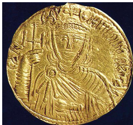
Фиг. 1. Златният медальон на Омуртаг с надпис „На кан сюбиги Омуртаг”

Изобразяването на Омуртаг с одеждите и регалиите на византийски василевс не цели нищо повече от това да покаже, че е равностоеен по власт с византийския император, а в по-широкия смисъл на тълкуване на кръста, че властта му е дадена от Бога. Изобщо цялото изобразяване на владетеля по този чисто византийски начин означава, че българският кан цели да изтъкне своята сила, могъщество и власт, като нагледно заяви, че канската титла е равностойна на императорската, въпреки че византийските василевси никога не признават официално това.