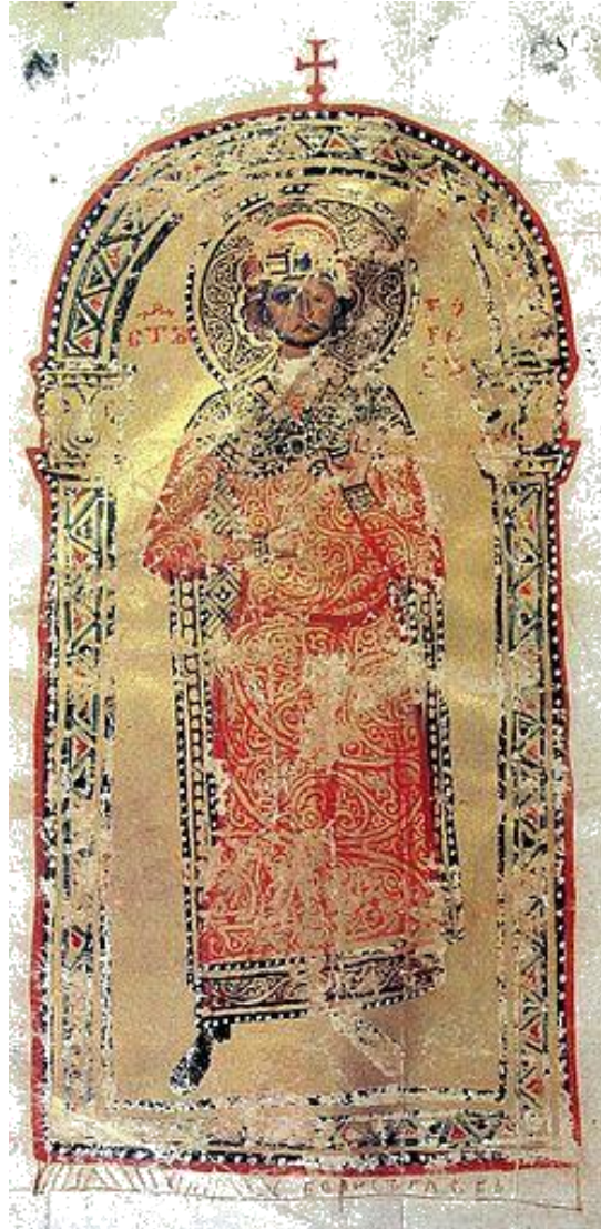
Фиг. 4. Миниатюра на княз Борис в Учителното евангелие на Константин Преславски (ГИМ, Син 262, XII в.)

Mavrodinova, V., L. Mavrodinova, 1999). “С изобилието от злато и перли по костюма, с инкрустационната техника на рамката, наподобяваща емайлите, миниатюрата прилича много на произведение на златарството. Този неин характер, както и надписът от страни на главата на изображения – сѣъ Борисъ – биха могли да се изтълкуват и като белези за по-късна дата на изработването на оригиналната миниатюра, когато Борис след смъртта си е бил признат за светец” (Ivanova-Mavrodinova, V., 1968).