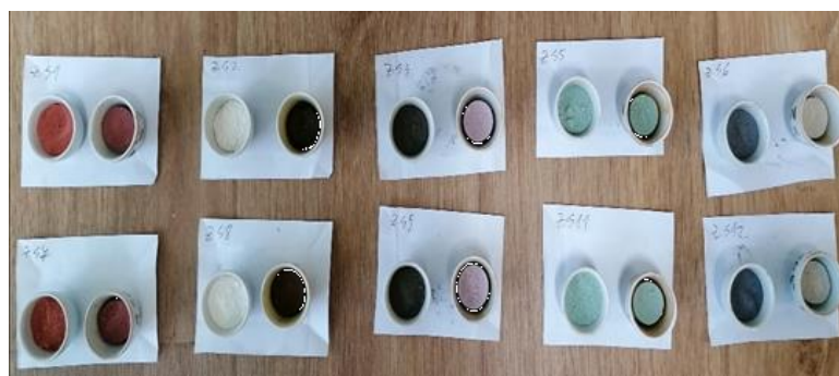
Фиг. 1 Изходни шихти и изпечени пигменти– отляво при всеки състав е шихтата, отдясно – синтезирания при 1200°C пигмент

Шихтите се приготвят като се претеглят съответните количества от изходните компоненти, смесват се и се подлагат на съвместно смилане и хомогенизиране в планетарна мелница Pulverisette 6 (Fritsch, Germany). Материалите се смилат при 150 об./мин. в продължение на 1 час, тези условия са достатъчни суровините да придобият размери на частиците от порядъка на микрометри. Количеството на всеки от съставите се разделя на три равни части. Така тридесетте проби се поставят в порцеланови тигли и се изпичат в пещ по 10 броя при три крайни температури на изпичане: 1000°C, 1100°C и 1200°C с изотермична задръжка от 3 часа. На фиг. 1 са представени снимки на изходните шихти и синтезираните пигменти.