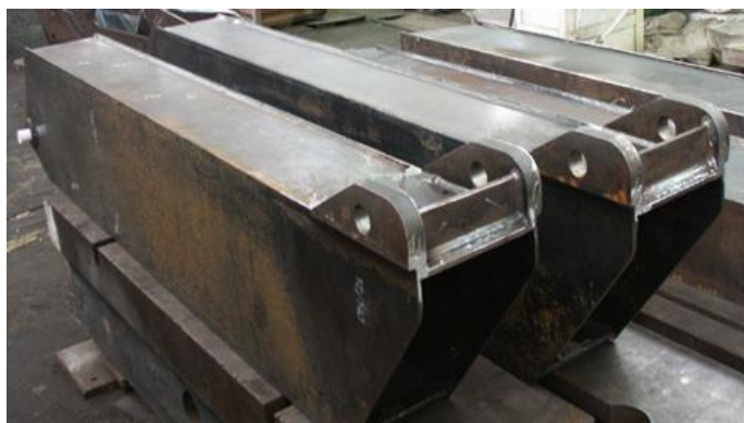
а) Общ вид