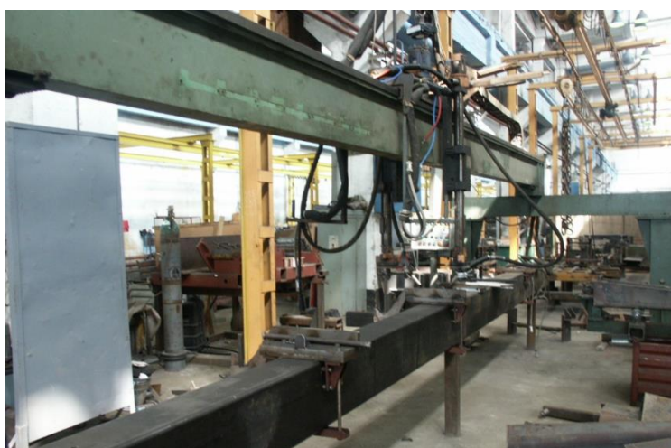
Фиг. 1. Промислена уредба за автоматизирано заваряване по твърд контур „Пирин“

Експерименталните изследвания са проведени в индустриални условия. За целта е използвана промишлена уредба за автоматизирано заваряване чрез водене по твърд контур – „Пирин“, показана на фиг. 1. Изработени са два опитни образеца на стабилизатори за автокран от стомана S355JR, представляващи греди с дължина 2290 mm. Изделията се състоят от четири страници и допълнителни конструктивни елементи с по-малки размери – фиг. 2 а). Четирите плочи, образуващи тръбата, са предварително съединени чрез заваръчни прихватки. На следваща операция е извършено заваряването на надлъжните шевове едновременно по два – фиг. 2 б). Измерванията на преместванията в напречно направление по време и след заваряване са извършени преди да се заварят допълнителните детайли. Режимите на заваряване са дадени в таблица 1.