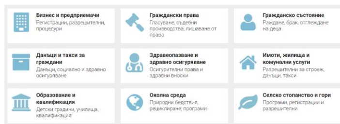
Фиг.2. Извадка на разделенията в единия портал за достъп до ЕАУ.

заявяване. 120 В българския единен портал за достъп до ЕАУ насочеността е към определени разделения по сфери, като например гражданско състояние, социални дейности и други (Фиг.2.).