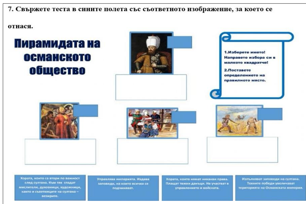
Фиг. 2. Свържи текста с правилната илюстрация