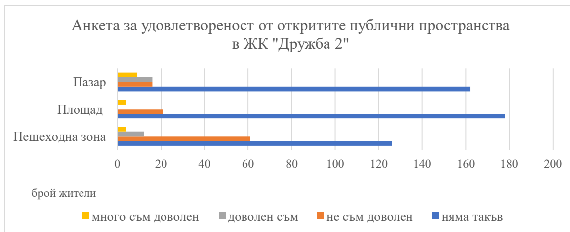
Фиг. 2. Резултати от анкета проведена сред 203 участници, жители на ЖК „Дружба 2“, относно удовлетвореността им от обществените открити пространства (август 2025 г., собствено проучване)

В проведено проучване през м. август 2025 г. сред 203 участвали жители от квартала, на възраст от 16 до 71 години чрез писмено и онлайн допитване беше установена много ниско ниво на удовлетвореност от откритите публични пространства (фиг. 2).